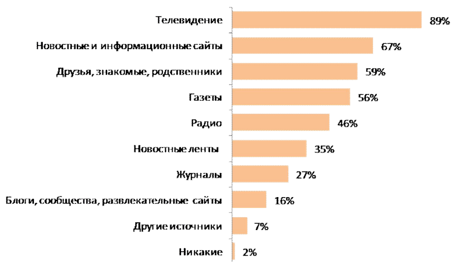
Рис. №3: Укажите, из каких источников Вы получаете информацию о кризисе?

Отметим, что достаточно сильное информационное воздействие оказывает так называемое «сарафанное радио» - почти 60% опрошенных отметили, что узнают о кризисе из рассказов знакомых, родственников и друзей (см. рис. №3).