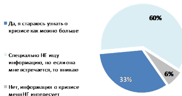
Рис. №2: Сейчас в средствах массовой информации все больше появляется информации о кризисе. Скажите, интересуетесь ли Вы этой информацией?

Порядка 60% опрошенных указали, что информацию о кризисе специально не ищут, но если она попадает, они стараются вникнуть и понять, что происходит в стране и в мире. Еще 1/3 участников исследования отметила, что старается узнать о кризисе как можно больше (см. рис. №2). Именно поэтому эти люди не только внимают, тому, что говорят в новостных программах, но и сами участвуют в поиске интересующих их сведений.