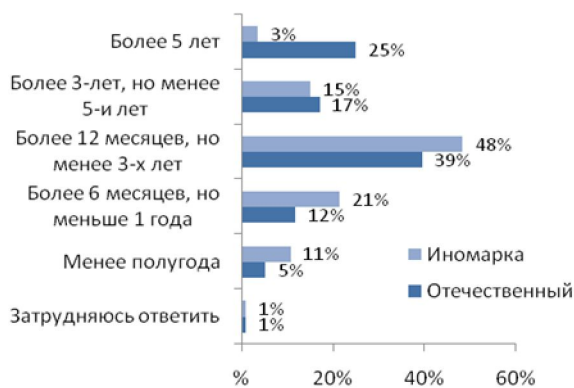
Рис. №2: Как долго Вы ездите на своем нынешнем авто (на вопрос отвечали только те, кто покупал новые машины)?