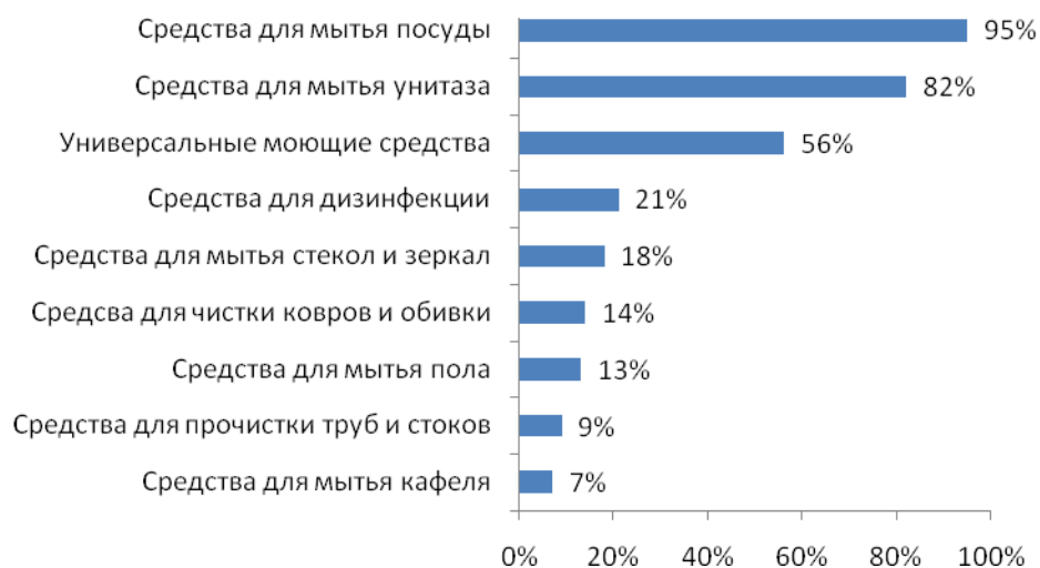
Рис. №4: Какие моющие средства по уходу за жильем есть в вашем доме?

Из представленных на российском рынке моющих и чистящих средств по уходу за домом наиболее широко в домохозяйствах используются средства для мытья посуды (имеются у 95%), для мытья унитаза (82%) и универсальные моющие средства (56%). Видимо, именно за счет последних многие наши соотечественницы компенсируют отсутствие специальных веществ, предназначенных непосредственно для мытья пола, кафеля и других нужд (см. рис.№4).