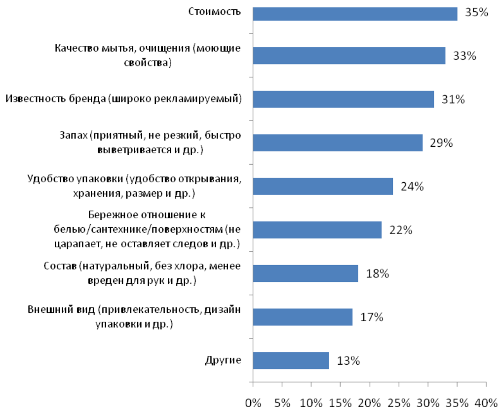
Рис. №1: Выбирая чистящие/моющие средства, на какие характеристики вы обращаете внимание?

Выяснилось, что выбирая чистящее или моющее средство, первое, на что обращают внимание женщины – это стоимость продукта (35%) и качество мытья/очистения (33%). Оказалось, что такие характеристики как содержание опасных для здоровья веществ (например, хлора), степень вреда для кожи не очень беспокоят их: при принятии решения купить то или иное средство на эти качества смотрят только 18% опрошенных. А вот известность бренда волнует больше – на это обращают внимание около 31% респонденток (см. рис.№1).