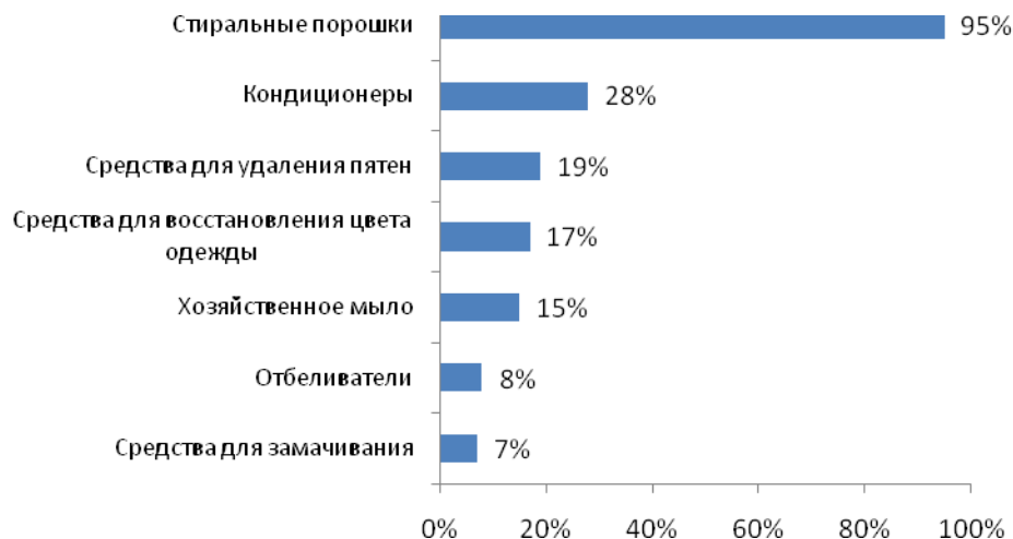
Рис. №2: Какие средства для стирки есть в вашем доме?

Интересно и то, что при наличии огромного выбора средств, предназначенных для выведения пятен и стирки одежды, 15% российских женщин хорошо помнят и хранят верность известному на протяжении не одного десятка лет хозяйственному мылу. По всей видимости, в качестве альтернативы, только 19% используют специальные средства для удаления пятен вместо привычного и знакомого всем хозяйственного мыла. А вот отбеливатели остались лишь у 8%. Среди широкого разнообразия средств, предназначенных для ухода за бельем, нашлись такие, которые смогли заменить это столь необходимое, но вредное и неудобное в применении средство (см. рис.№2).