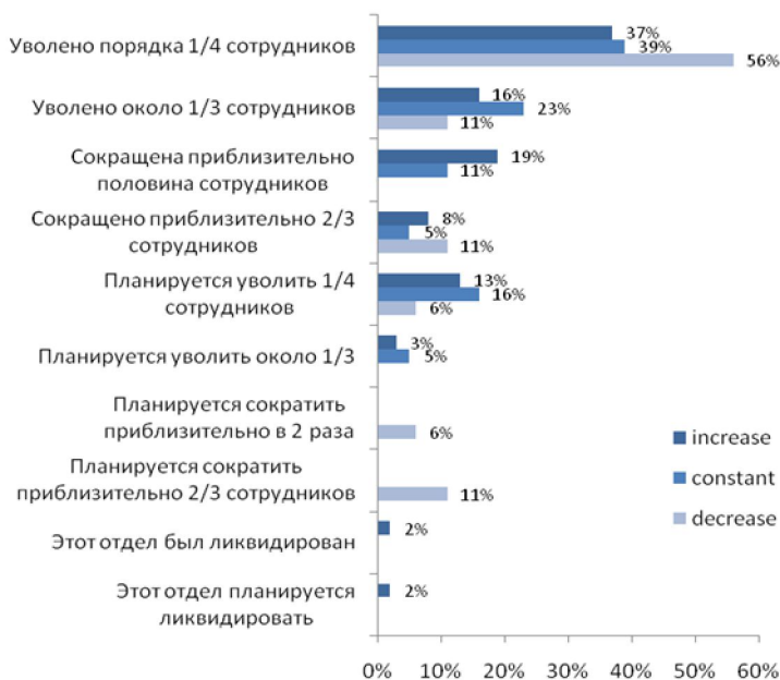
Рис. №2: Изменения в размере штата сотрудников, занятых в сфере маркетинговых коммуникаций

Отметим, что в большинстве организаций, которые урезали бюджет на маркетинговые коммуникации, волна сокращений уже прошла, однако в случае продолжения кризиса и ухудшения ситуации но планируются новые увольнения (см. рис. №2).