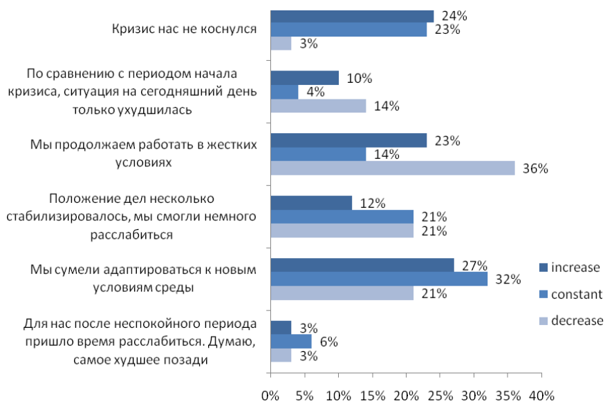
Рис. №1: Как изменилась ситуация в Вашей компании при сравнении периодов с началом кризиса и настоящим моментом?

тех, чьи компании кризис не затронул, либо они уже успели подстроиться под новые реалии действительности. Таких представителей оказалось немало и в группе компаний, которые бюджет на маркетинг не меняли.