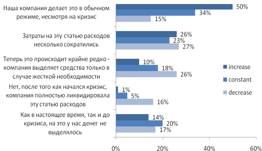
Рис. №5: Готова ли Ваша компания в условиях кризиса отправлять своих сотрудников, занятых в сфере маркетинга, PR или рекламы, на различные мероприятия, способствующие обмену опытом и по повышению их квалификации (тренинги семинары, конференции, курсы дополнительного образования и др.)?

Из тех, кто в условиях кризиса бюджет не менял, организаций, готовых тратить на профессиональный рост своих сотрудников прежние суммы, оказалось несколько менее 1/3 (см. рис. №5).