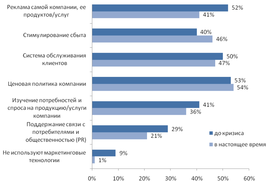
Рис. №6: Каким маркетинговым технологиям в связи с финансовым кризисом Вашей компанией стало уделяться больше внимания? Выберите не более трех основных направлений.

Аализ показал, что организации, которые были вынуждены сократить расходы на маркетинг, сделали это за счет рекламы, а также за счет изучения потребностей и спроса на продукцию и поддержания связей с потребителями. В то же время, их деятельность значительно активизировалась в направлении стимулирования сбыта и ценовой политики (см. рис. №6).