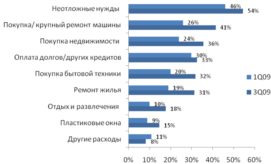
Рис.№2: На какие нужды Вы готов взять кредит?

Если более внимательно посмотреть на цели, для осуществления которых люди планируют использовать заемные деньги, можно увидеть, что большинство берет в долг на жизненно необходимые вещи. Например: на еду, лечение и проч. (неотложные нужды) – 54%. Почти в два раза возросло количество тех, кто решил занять у банка, чтобы купить/отремонтировать машину (с 26% в I квартале 2009 года до 41% в III квартале) или сделать ремонт дома (с 19% до 31%). Постепенно начинает увеличиваться интерес респондентов к ипотечному кредитованию: так к концу 2009 года порядка 1/3 участников исследования, нуждающихся в кредите, отметили, что подумывают просить у банка средства на покупку жилья (см. рис.№2). Елена Смирнова объясняет это тем, что, несмотря на кризис, государство предпринимает меры, чтобы банки выдавали ипотечные кредиты. А россияне, в свою очередь, видя, что цены на жилье несколько «просели» стараются не упустить шанс сделать выгодную покупку недвижимости.