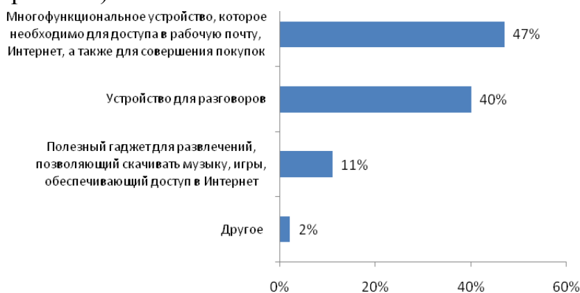
Рис. №1: Мобильный телефон для Вас – это (закончите фразу)

Согласно полученным данным только 40% участников исследования относятся к сотовому телефону исключительно как к средству связи. В то же время для 47% мобильник стал значить гораздо большее – устройство, которое позволяет не только общаться с людьми, но и выходить в Интернет, совершать денежные операции, слушать музыку, фотографировать и проч. Интересно, что для каждого десятого опрошенного основная функция телефона вовсе отошла на задний план. Эти люди расценивают «трубку» как своего рода полезную игрушку. Для них такие ее возможности как скачивание музыки, игр, пользование Интернетом и др. выходят на первый план (см. рис. №1).