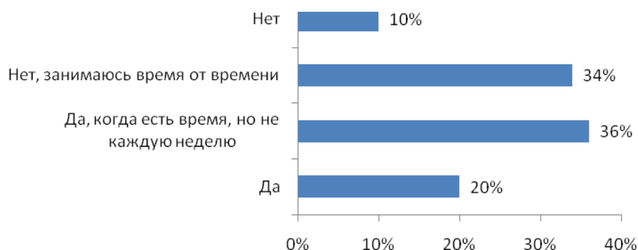
Рис. №1: Занимаетесь ли Вы спортом регулярно (1 раз в неделю и чаще)?

Как становится ясно из рисунка №1, только 1/5 часть опрошенных отметила, что регулярно занимается тем или иным спортом, в то время как в свободное от других дел время, спортивным нагрузкам посвящают свое время около 1/3 респондентов. А каждый 10-ый из опрошенных отмечал, что в его жизни спорту нет места.