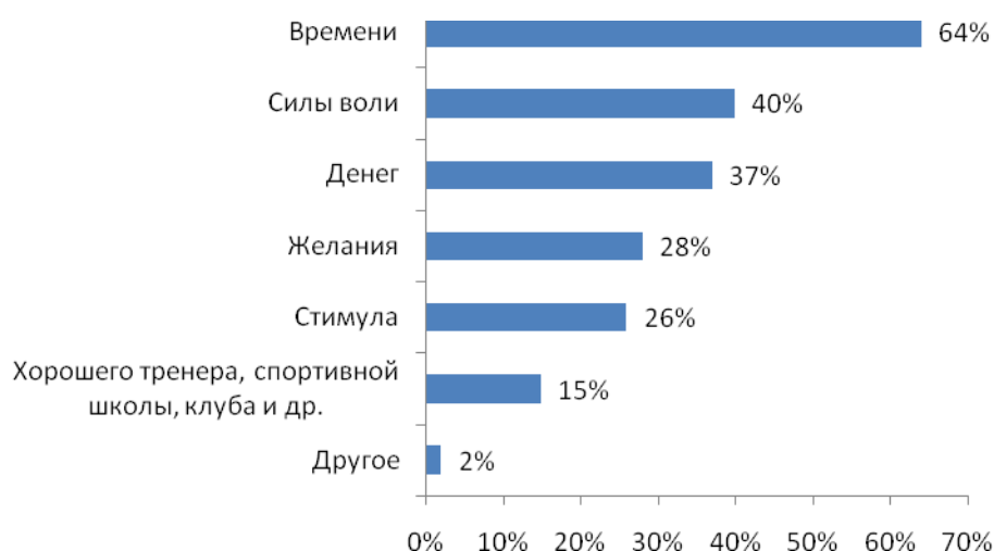
Рис. №3: Чего Вам не хватает для того, чтобы начать заниматься спортом или делать это чаще? Выберите одну-три наиболее значимых причины.

Исследование также показало, что 66% респондентов с различной регулярностью, но спортом занимаются (см. рис. №1). Что же является причиной, которая мешает уделять необходимое внимание своей физической форме большинству опрошенных? Порядка 64% указывают на недостаток времени как на одно из самых главных препятствий на пути к здоровому образу жизни. Еще 40% не хватает силы воли. Более чем треть респондентов признались, что преградой является нехватка денег. Также, более четверти участников исследования сослались на отсутствие стимула и желания, которые бы смогли сподвигнуть их на спортивные «подвиги». Интересно, что 15% заниматься спортом не позволяет отсутствие достойных наставников, спортивных комплексов и т.д.