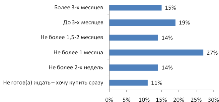
Рис. №3: Сколько Вы готовы ждать машину желаемой комплектации?

Большинство респондентов отметило, что не готово ждать машину желаемой комплектации дольше 1 месяца (порядка ¼ опрошенных). Однако, существует достаточно крупный сегмент покупателей (48%) готовый ждать до 3-х месяцев и даже больше (см. рис.№3).