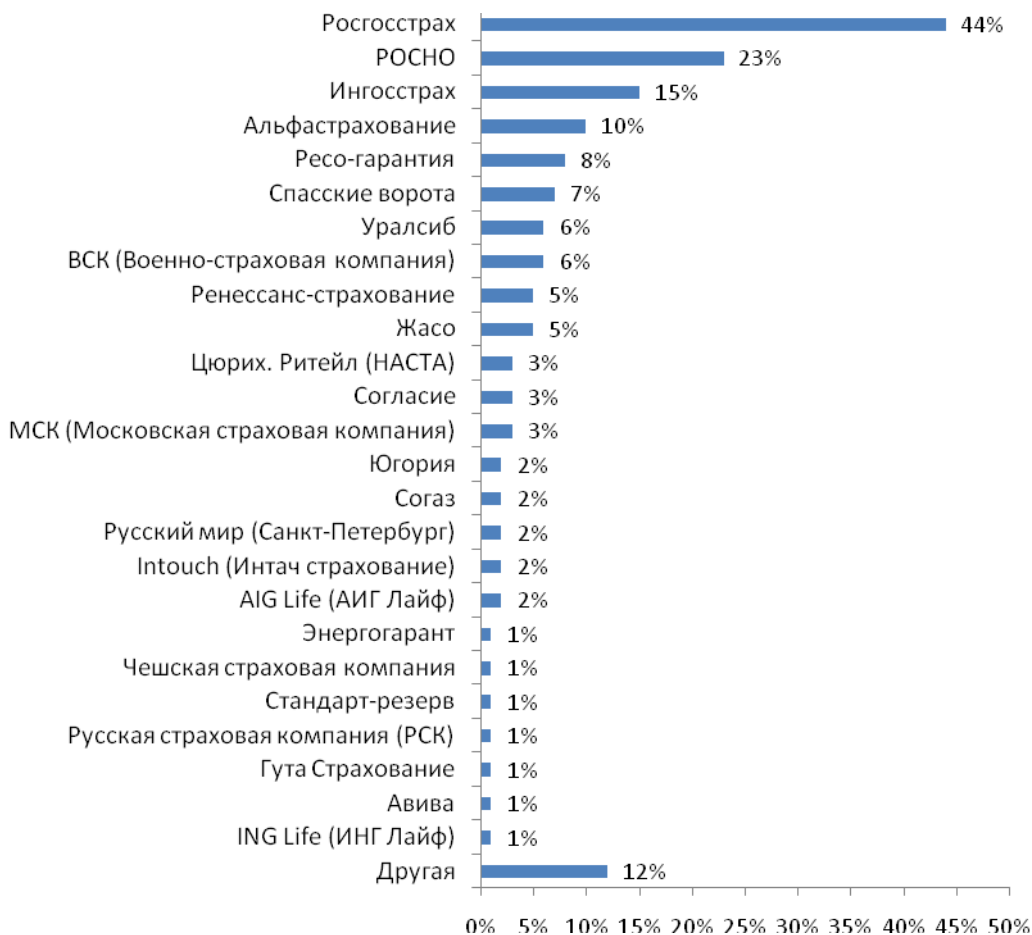
Рис. №1: Текущее пользование услугами страховых компаний

Отметим, что из 44%, указавших, что пользуются услугами «Росгосстраха», 37% считают эту компанию своим основным страховщиком. Из 23% клиентов «РОСНО» привязанность к ней испытывают 13%, которые считают эту компанию своей основной страховой организацией. Относительно «Ингосстраха», из 15% тех, кто прибегает к его услугам, менее половины (6%) считают этого страховщика своим основным. Таким образом, становится понятно, что если человек и оформил страховку в той или иной компании, это вовсе не значит, что у него существует приверженность к ней. И, вероятнее всего, если конкурент предложит более выгодные условия, клиент, не задумываясь, перейдет к нему (см. рис. №2). Более того, 7% участников исследования отметили, что не считают ни одну из компаний, у которой они приобретали страховку, своей основной. Скорее всего, эти люди были вынуждены оформить договор с тем или иным страховщиком не осознанно (приобретали страховку в составе пакета другой услуги). Например, при получении ипотеки или автокредита, банки обязывают заемщиков застраховать кредит и чаще всего предлагают для этого свою страховую компании.