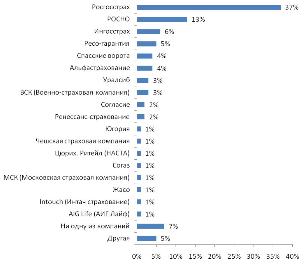
Рис. №2: Какую страховую компанию Вы считаете своей основной?

Абсолютное большинство клиентов отечественных страховых компаний выразили высокую степень удовлетворенности предоставляемым уровнем обслуживания – 93%. И лишь 7% участников исследования отметили, что есть некоторые вещи, которые в обслуживании им не нравятся.