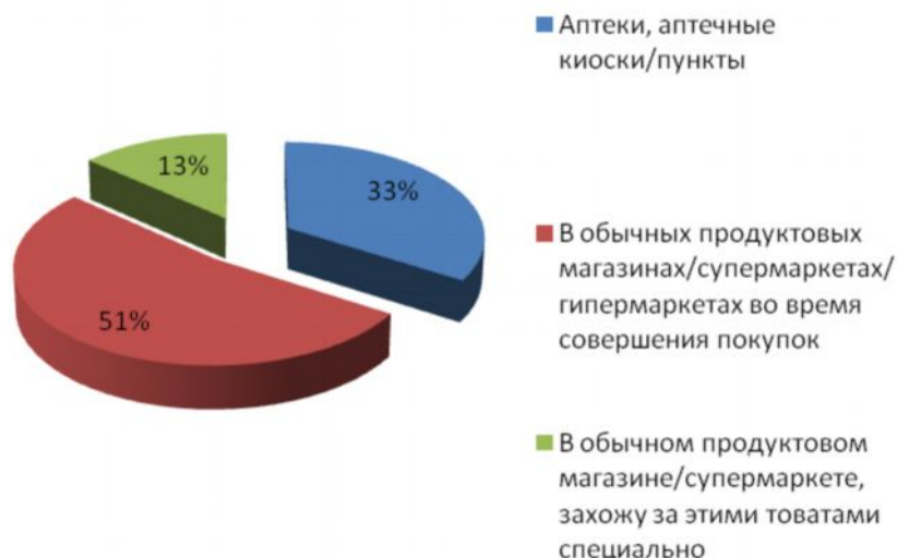
Рис. №1: Где вы обычно покупаете изделия медицинского назначения (презервативы, зубные щетки, зубная паста и др.)? Как показали результаты исследования, жители крупных российских городов склонны выделять только детскую зубную пасту: лишь в 13% случаев люди заботятся о подборе индивидуального средства для чистки зубов каждому члену семьи. Почти 30% опрошенных пользуются одной пастой на всех, включая детей (см. рис. №2).

В результате исследования выяснилось, что к выбору и покупке товаров медицинского назначения люди относятся не так серьезно, как приобретению лекарственных препаратов. Более половины респондентов (51%) покупают средства личной гигиены, презервативы, зубные пасты и т.д. в супермаркетах и других торговых точках во время совершения остальных покупок. Лишь 13% целенаправленно заходят в магазин именно за этими товарами. Для сравнения, половина опрошенных отмечала, что ходят за лекарствами только в специальные аптеки и крупные аптечные сети, и только 17% были готовы приобретать их в торговых центрах и супермаркетах (см. рис. № 1).