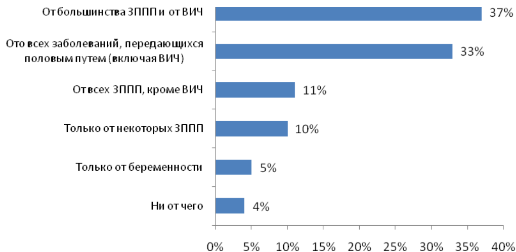
Рис. №6: Как вы думаете, от чего могут защитить вас презервативы?

По мнению многих жителей российских городов, презерватив защищает от всех ЗППП, в том числе и ВИЧ (так считают 33% респондентов). Еще 37% уверены, что, благодаря нему, можно предотвратить большую часть половых инфекций (включая ВИЧ). По мнению 21% опрошенных, данное средство защищает не ото всех инфекций, а 9% россиян не верят презервативу вообще и считают, что максимум, на что он может быть способен – предотвратить нежелательную беременность (см. рис. №6).