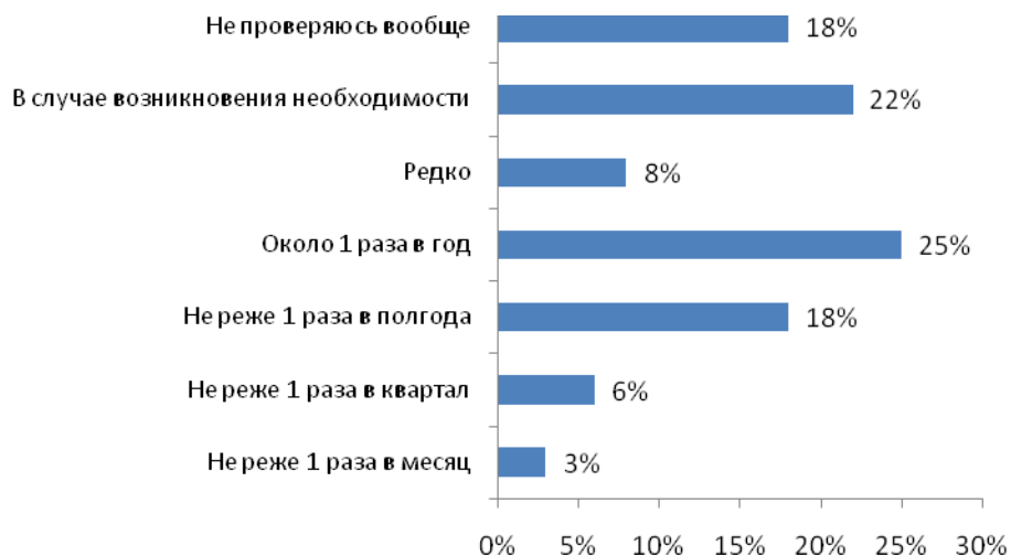
Рис. №5: Как часто вы проверяетесь на предмет заболеваний, передающихся половым путем (ЗППП)?

Также в ходе исследования респондентам был задан вопрос о том, как часто они проверяются на предмет заболеваний, передающихся половым путем. Выяснилось, что 25% делают это около 1 раза в год, 18% вообще не сдают анализы, а 22% пойдут проверяться только в случае необходимости, которая может быть обусловлена возникновением подозрений на инфекцию (см. рис. №5). Данные цифры свидетельствуют о том, что россияне часто оставляют без внимания многие опасности, которые несет незащищенный секс. К сожалению, многие не понимают всей серьезности проблемы, несмотря на то, что врачи давно бьют тревогу по поводу того, что в России число людей с ЗППП неуклонно растет.