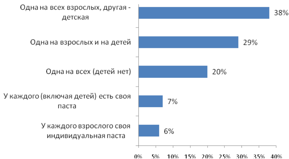
Рис. №2: Сколько видов зубной пасты есть в вашем доме (одновременно используется)?

Если говорить о средствах контрацепции, наиболее востребованный метод предохранения среди россиян – использование презервативов (ими пользуются около 71%), Около 17% отметили, что используют контрацептивы. А 19% жителей крупных городов вообще не используют никакие средства, защищающие от беременности и заболеваний, передающихся половым путем (см. рис. №3).