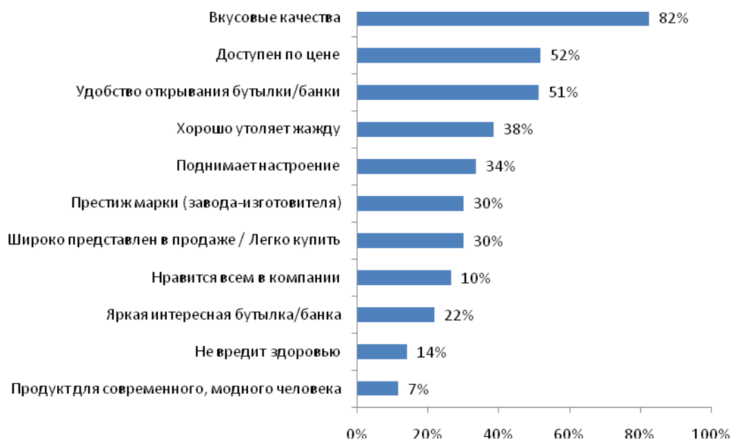
Рис. №2: Факторы, влияющие на выбор марки пива

качества. Следующий важный факт - доступность марки по цене и удобство открытия бутылки/банки. На это указали более половины респондентов. На третьем месте по значимости оказалась способность пива утолять жажду, а также и такие факторы как поднятие настроения и престиж марки. Таким образом, вышеперечисленные атрибуты оказались для молодых потребителей важнее, нежели чем, к примеру, безопасность продукта. Так, на вероятность причинения вреда здоровью обращают внимание только 14% респондентов, которые стараются покупать «проверенные» марки. К сожалению, для большей части людей (30%) имидж того или иного пивного бренда оказывается важнее, нежели чем что-то еще (см. рис.№2).