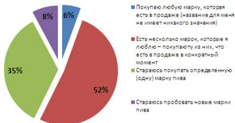
Рис. №1: Потребительские предпочтения в отношении выбора марки пива

Выяснилось, что более половины участников опроса определились со своими предпочтениями в отношении пива: у них имеется 2-3 любимых бренда, которые они приобретают в зависимости от того, что есть в торговой точке на момент совершения покупки. Также достаточно велика и доля тех, кто старается постоянно покупать одну и ту же марку: она составляет 1/3 от всех опрошенных. Новаторов, готовых постоянно пробовать все новое, что появляется на рынке 8% (см. рис.№1). «Обычно доля новаторов по товарам других категорий не превышает отметки в 5%, - констатирует директор по исследованиям компании Profi Online Research Виктория Соколова. – Несомненно, столь высокий процент новаторов, в первую очередь, обусловлен возрастом аудитории. Потому что, как известно, молодые люди более склонны к экспериментам». Одновременно с этим, 87% опрошенных отмечают, что точно знают, какие марки пива будут искать, придя в магазин.