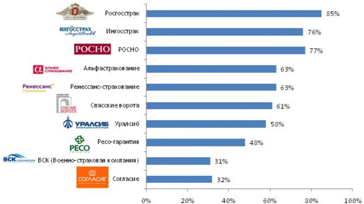
Рис. №2: Знание логотипов страховых компаний с подсказкой

Со знанием логотипов страховщиков дела обстоят несколько иначе. Знание имени той или иной компании и уровень узнавания ее логотипа далеко не всегда совпадают. Так, к примеру, логотип «Ингосстраха» в IV квартале 2009 года, узнали 76% респондентов, в то время как это название этой организации знакомо 89% опрошенных. Компания «Альфастрахование» по итогам года была известна 82%, логотип же организации узнали лишь 63%. Существуют и обратные ситуации. Так, «МСК» известна 28% опрошенных, в то время как ее логотип знает гораздо большее число респондентов – 37%.